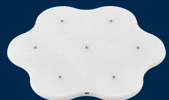
Decopower Multicharger 7