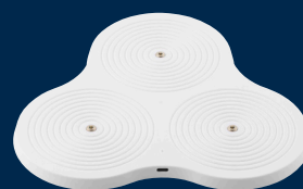
Decopower Multicharger 3

Durch das diskrete Design kann man das Ladegerät entweder draußen stehen lassen oder wegpacken - je nachdem, wie oft man es aufladen möchte.